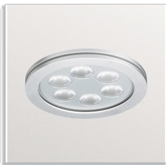
TurnRound BBG390 IP54 fixed downlight with narrow or medium-beam optic